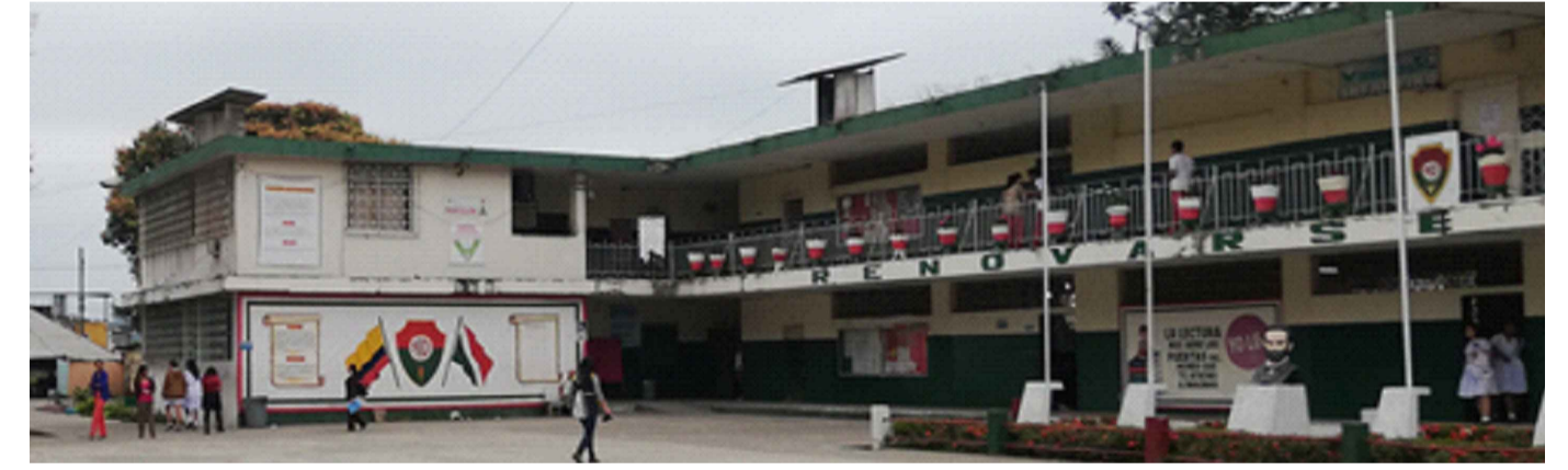
FOTO 3 Vista Fachada Frontal