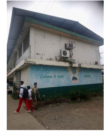
FOTO 2 Vista Lateral Derecha