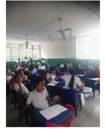
FOTO 4 Vista Interior Aula