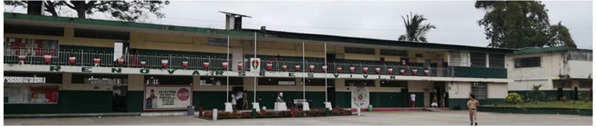
FOTO 1 Vista Fachada Frontal